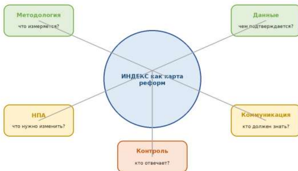
Рисунок 3. Матрица преобразования индекса в управленческое решение