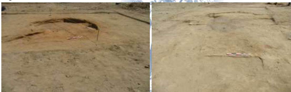
2-rasm. Rabod hududidagi kulolchilik xumdoni.

2018 yilda Eski Termiz shahristoni mudofaa devorining shimoliy tomonida joylashgan o'rta asrlarga oid xumdon va uning atrofidagi kulolchilik ustaxonasi ochib o'rganildi. Qazishmaning o'lchami 15x20 m kv ni tashkil etadi. Yodgorlik ustidagi sochilib yotgan pishiq g'ishtlarning siniqlari va turli shakldagi sopol buyumlarning bo'laklari, ayniqsa ko'p miqdordagi uchraydigan simob ko'zchalari uning quyi qatlamida kulolchilik xumdoni borligidan darak berardi.