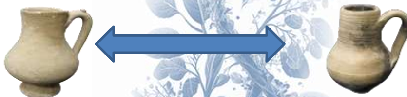
Svam 3529/1. Bir baldoqli ko'za. IX-XII asrlar

Svam 3529/1. Bir baldoqli ko'za. IX-XII asrlarga oid Eski Termizdan topilgan bo'lib, o'lchami: balandligi – 14 sm, eni-4.5 tagdoni-4 sm ni tashkil etadi. Ko'zaning gardish qismi saqlangan bo'lib, gardishi tashqi qismga tomon qayrilmagan. Ko'zaning baldog'i gardishidan qismidan rezervuari tomon birikib ketgan. Ko'zaning rezervuaridan tagdoni tomon torayib borgan. Ko'zaning tashqi devor qismida kuygan izlari mavjud. Tagdoni tekis disksimon ko'inishda ishlangan saqlanish holati yaxshi. (RASM)