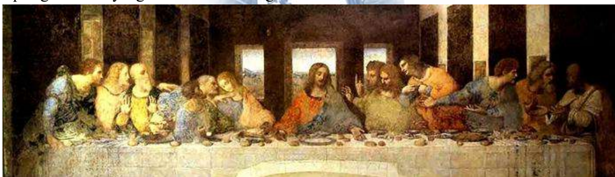
“Oxirgi kechki ovqat” asari.

Leonardoning “Oxirgi kechki ovqat” nomli monumental asari ham Yuqori uyg‘onish davri rangtasvirining eng yuksak namunalaridan biri hisoblanadi. Ushbu asarda Iso va uning shogirdlari o‘rtasidagi ruhiy holat, dramatik vaziyat va kompozitsiyaning markaziy yechimi nihoyatda mukammal tasvirlangan. Perspektivaning to‘g‘ri qo‘llanilishi asarning fazoviy chuqurligini kuchaytirgan va tomoshabinga kuchli ta‘sir ko‘rsatadi.