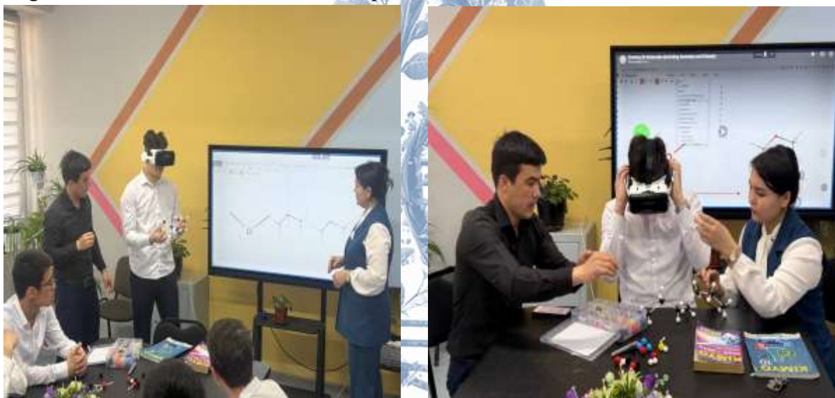
Rasm-1. Kimyo fanini o'qitishda 3D texnologiyalar, interaktiv modellar va raqamli vizual materiallardan foydalanilmoqda.

Toshkent shahrida joylashgan Olmazor tumanidagi 298-maktab o'quvchilari bilan olib borilayotgan innovatsion darslar ana shunday zamonaviy yondashuvlarning yorqin namunasidir. O'zbekiston Respublikasi Oliy ta'lim, fan va innovatsiyalar vazirligining tegishli topshiriq xatiga muvofiq, Toshkent davlat texnika universiteti professor-o'qituvchilari tomonidan tabiiy va aniq fanlar bo'yicha o'quvchilar bilimni oshirishga qaratilgan mahorat darslari tashkil etilmoqda.