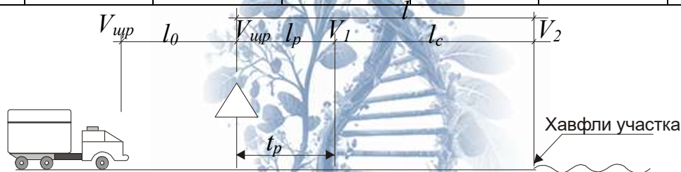
1-rasm. Xavfli uchastkadan oldin qo‘yiladigan yo‘l belgisi masofasini aniqlash sxemasi