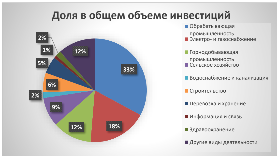
Рис. 2. Иностранные инвестиции и кредиты в основной капитал по Республике Узбекистан по видам экономической деятельности, доля в общем объеме инвестиций

Основными странами-инвесторами являются Китай, Россия, Турция. Южная Корея, Германия, Саудовская Аравия, ОАЭ, страны ЕС и США.